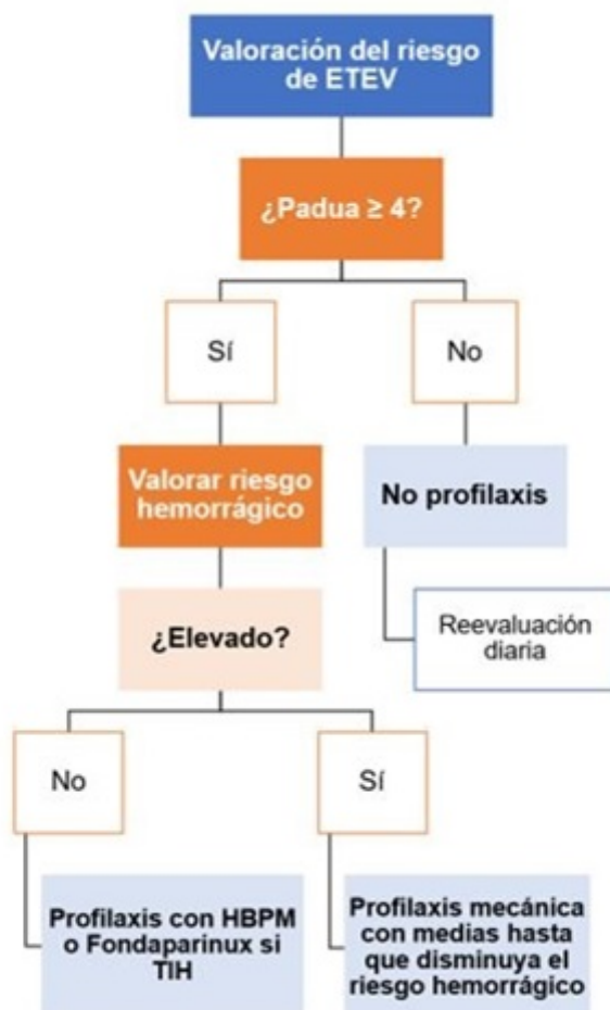
Figura 1: Protocolo hospitalario de uso de la tromboprofilaxis en el servicio de Medicina Interna