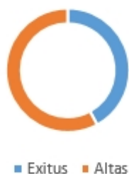
TRASLADADOS (Total 38)

Resultados: Total afectados 95. Muestra analizada 75. Traslados hospitalarios 38 (51%), los cuales, P1 8 (21%), P2 15 (40%), P3 15 (40%). Traslados inconvenientes 10 (26%), los cuales, 6 (P3), 4 (P2). Motivo traslados inconvenientes exitus precoz 8 (80%), sedación precoz 1 (10%), alta precoz 1 (10%). Fechas traslados inconvenientes primera semana de abril 1 (10%), segunda semana de abril 3 (30%), tercera semana de abril 6 (60%). Exitus trasladados 16 (42%). Altas trasladados 22 (58%). Altas reingresadas 3 (13%).